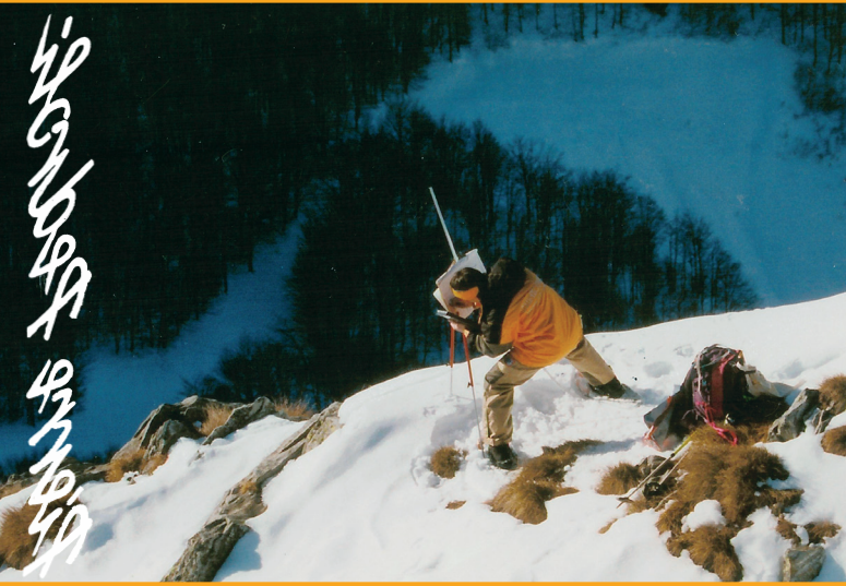
Pedroli "pittore delle Montagne / Bergmaler"